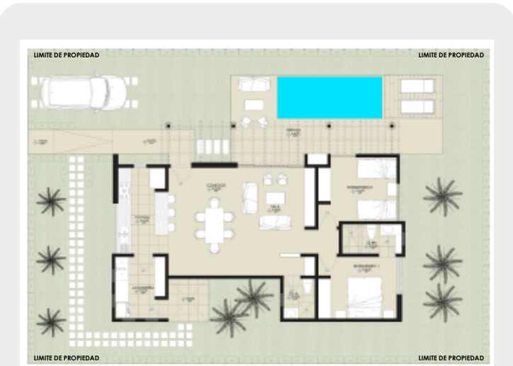
Plano de distribución arquitectónica - 1 nivel